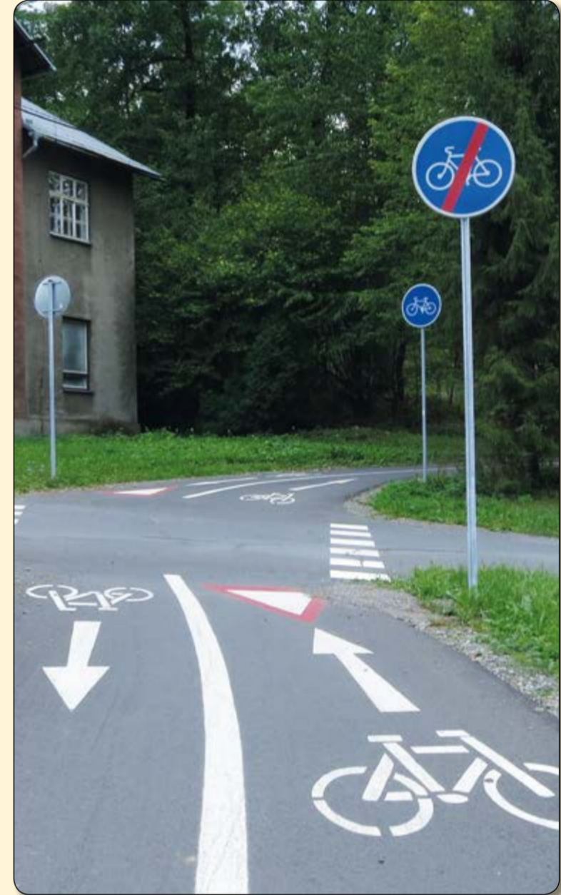
Řepiště – dopravní značení na křižovatce u bývalého hotelu Balkán