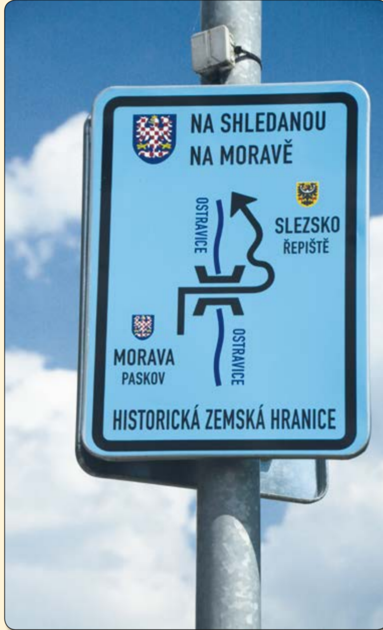
Paskov – návěští s informací o historické zemské hranici mezi Moravou a Slezskem