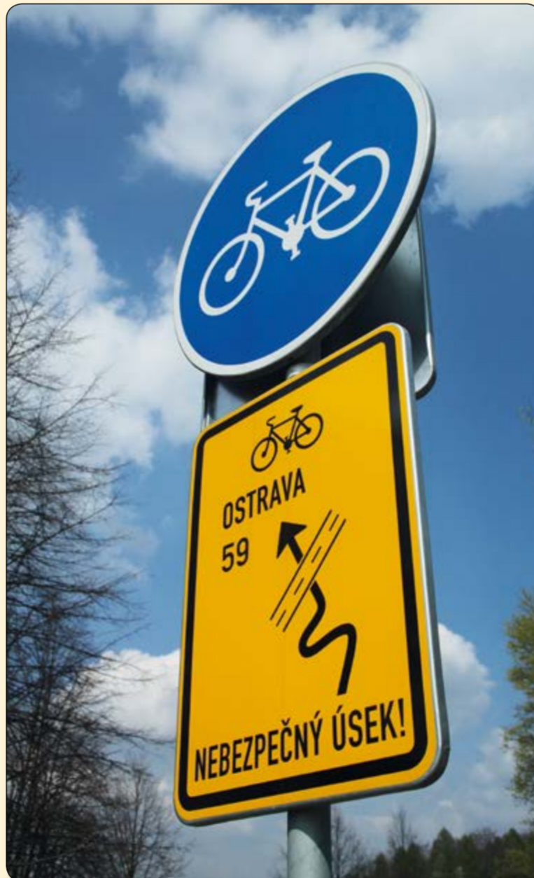
Řepiště – výstražná značka upozorňující na serpentinu sjezdu a křížení se silniční dopravou před nádražím ČD