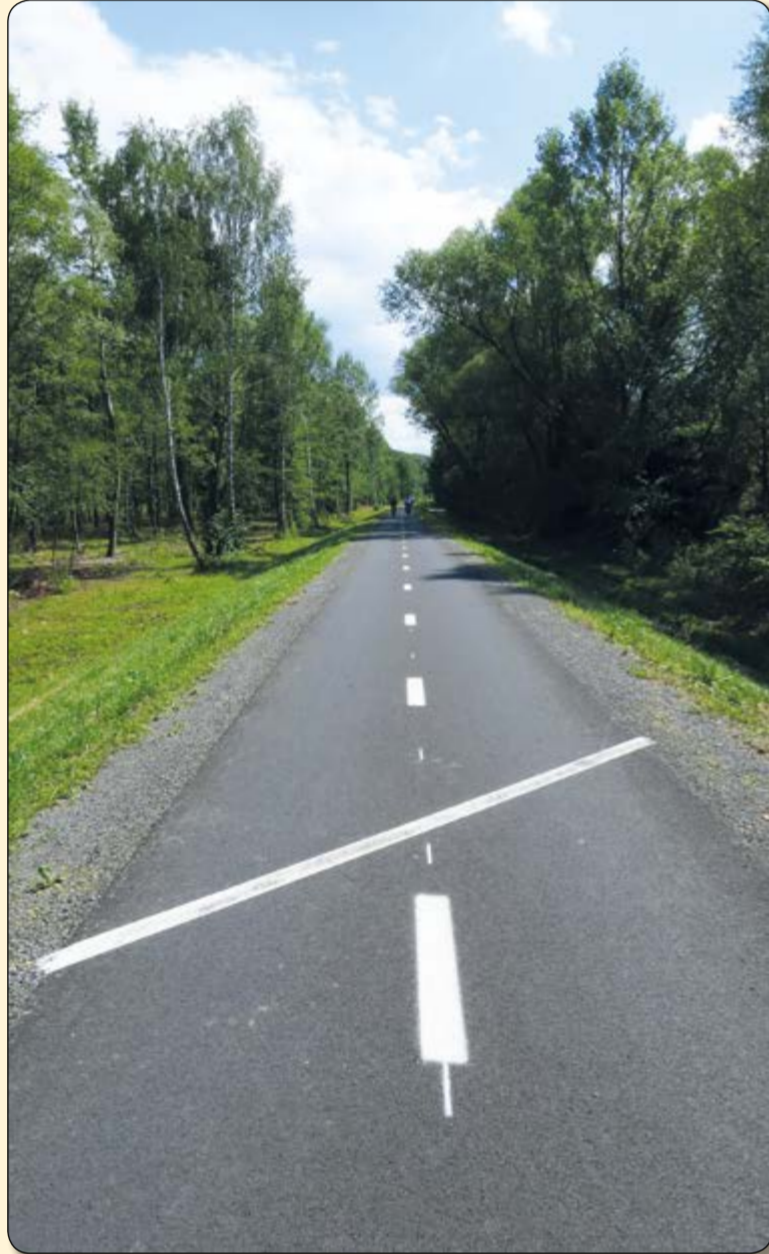
Zabeň – vodorovné značení s vyznačením hranice mezi Zabeň a Sviadnovem

bezpečnosti, včetně doplnění některých směrových značek, provedl Klub českých turistů. Cyklostezka se poté stala jednou z nejlépe značených cyklistických tras v celé České republice. Raritou na ní je zároveň čtveřice atypických návěští v okolí silničního mostu přes řeku Ostravici. Uživatelé cyklostezky informují o tom, že při přejezdu mostu překračují historickou zemskou hranici mezi Moravou a Slezskem.