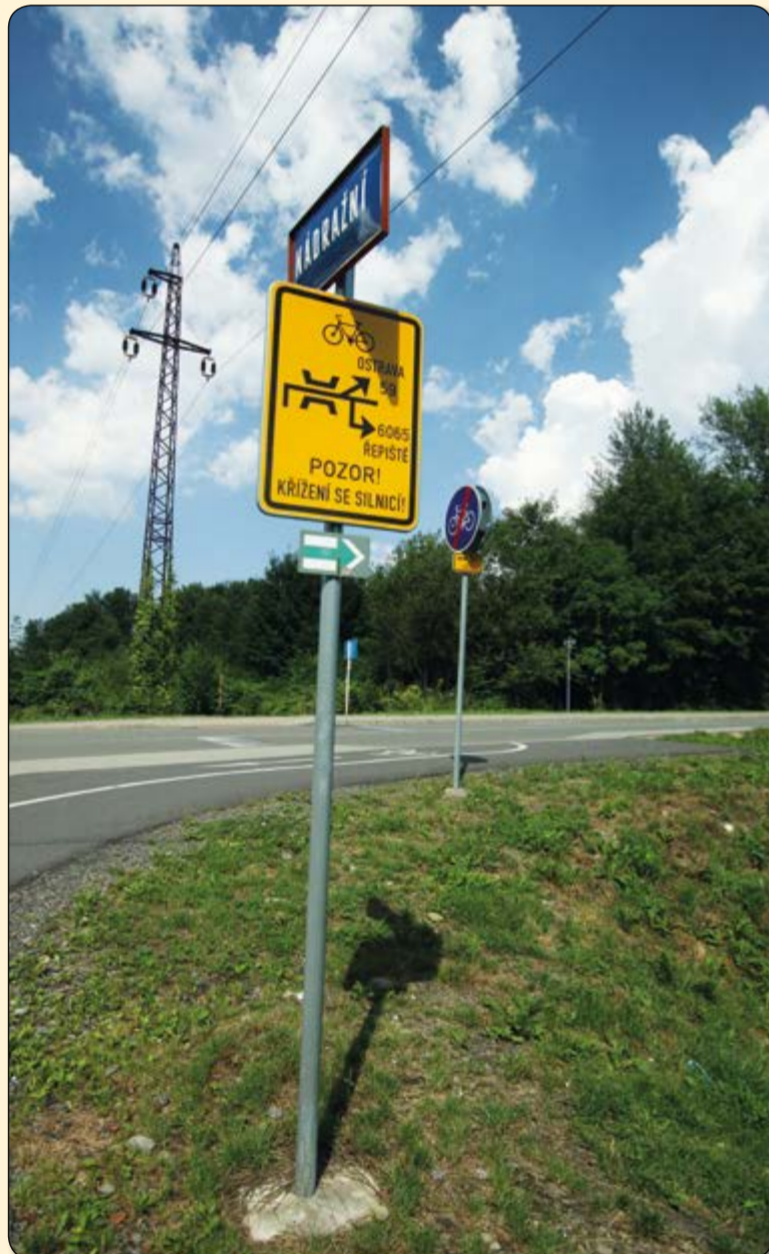
Paskov – výstražná značka pro křížení se silniční dopravou a s návěští křižovatky cyklistických tras