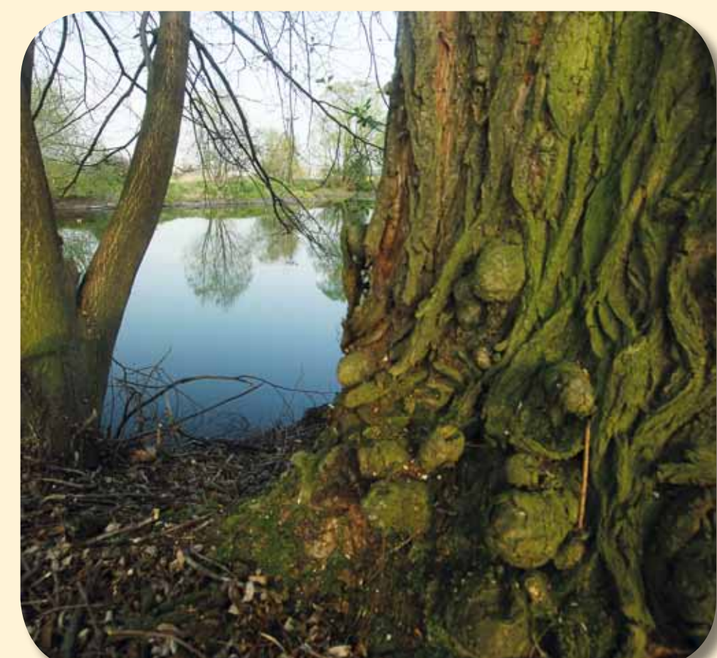
U žabeňských rybníků