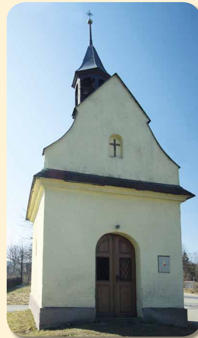
Kaple sv. Fabiána a Sebestiána

I v tak malé obci však může být bohatý spolkový a kulturní život. Největší spolky sice vznikly až v období samostatné republiky, ale už v době před první světovou válkou se zde objevili první předskokani: roku 1907 Čtenářská besídka a roku 1909 Odbor Národní jednoty. K nim pak v roce 1925 přibyla Jednota československého Orla, o čtyři roky později Dělnická tělocvičná jednota, za další rok Sbor dobrovolných hasičů a roku 1934 TJ Sokol.