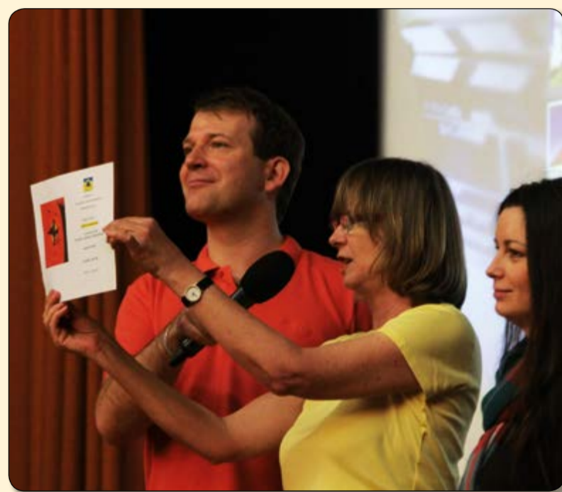
Vyhlášení výsledků soutěže Strašidla regionu Slezská brána (organizátor Městská knihovna Vratislavice)

Seznam kartiček pexeso "Strašidla Regionu Slezská brána očima dětí" (index - škola - třída - autor - věk - umístění v rámci obce)