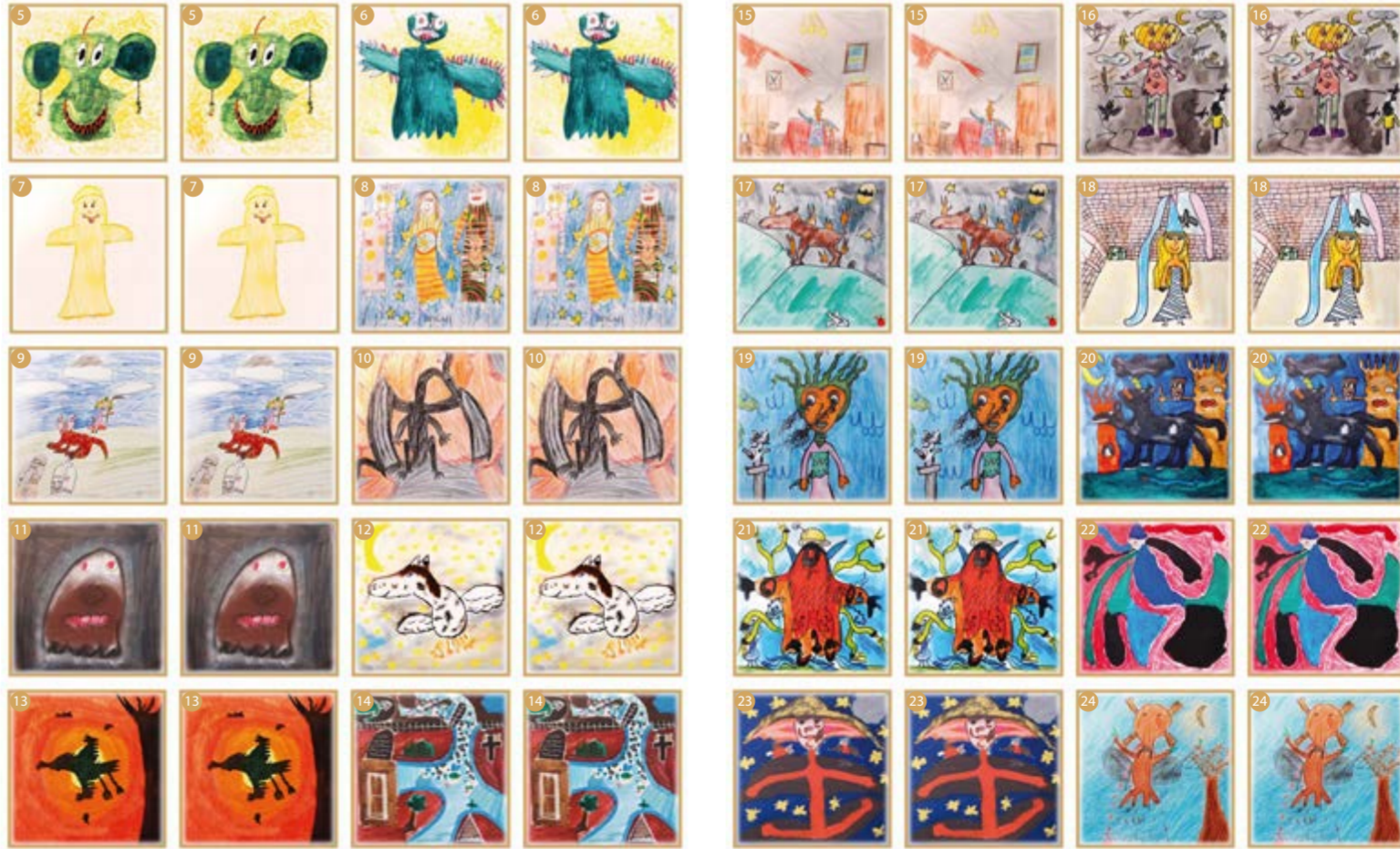
Pexeso - Strašidla Regionu Slezská brána jako výstup stejnojmenné soutěže (organizátor Městská knihovna Vratislavice)