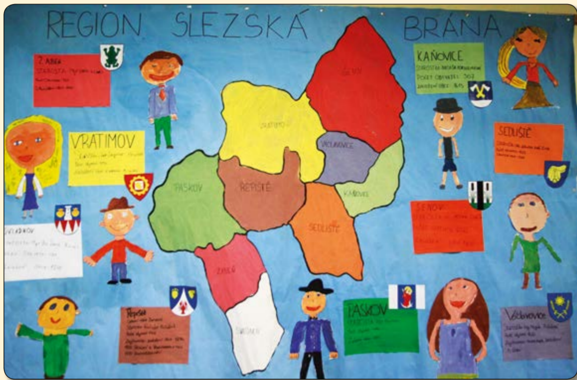
Soutěž Žijeme v regionu Slezská brána (organizátor ZŠ Sedliště) – výuková výzdoba chodeb školy

školy za úkol představit některou z obcí našeho regionu. V následujícím školním roce 2014/2015 podpořil Region Slezská brána, opět jako partner organizující ZŠ Sedliště, soubor tří projektů „Sedlišťský slavík“ (soutěž ve zpěvu), „Život kolem nás“ (výtvarná soutěž) a „Divadlo nás baví“ (představení školních dramatických souborů).