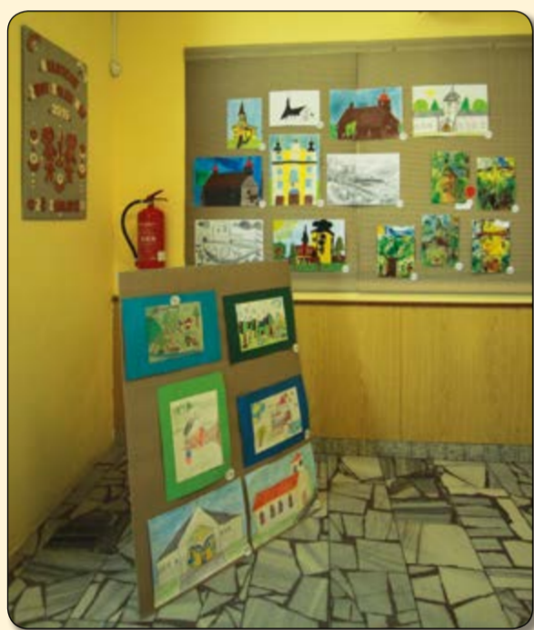
Výtvarné práce soutěže Život kolem nás (organizátor ZŠ Sedliště)