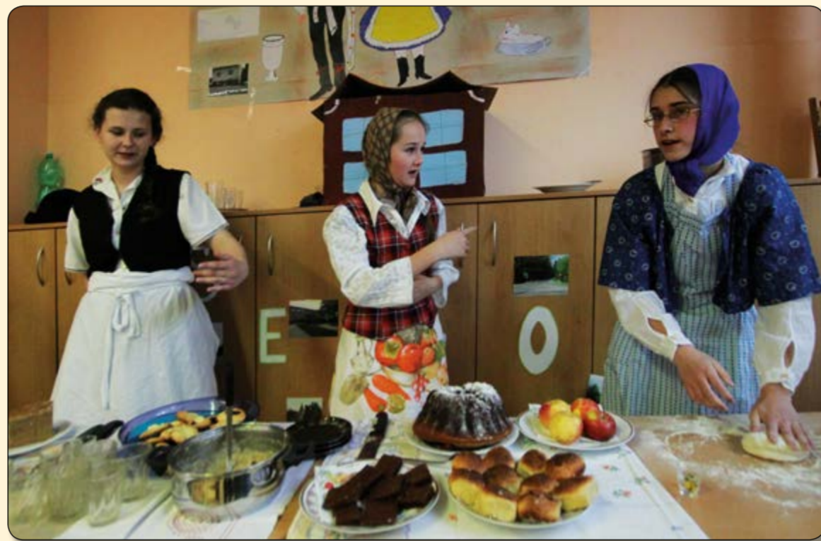
Soutěž Žijeme v regionu Slezská brána (organizátor ZŠ Sedliště) – divadelní scénka „Než přivezu koloče“