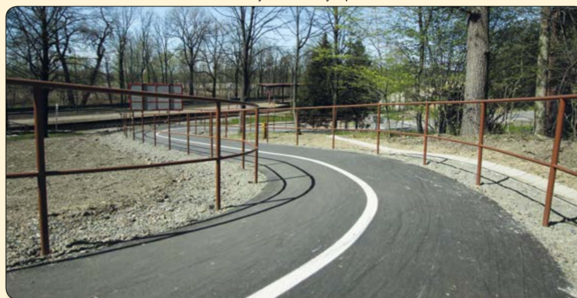
Řepiště – sjezd ze silničního mostu přes Ostravici k nádraží ČD Paskov