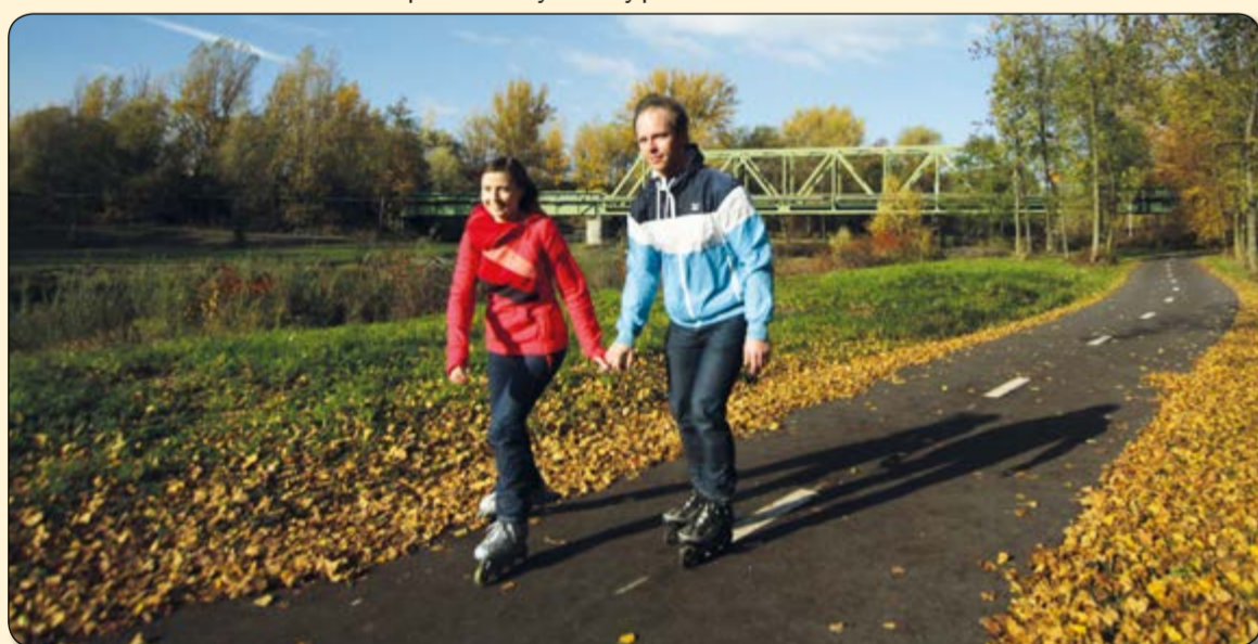
Řepiště – inlinisté u železničního mostu Dolu Paskov