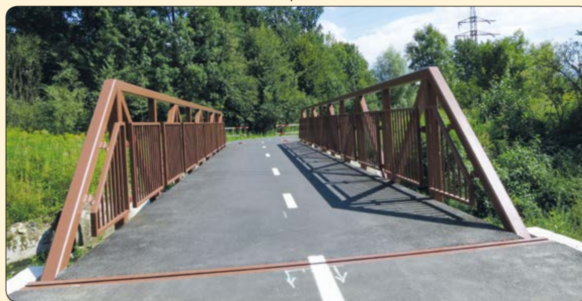
Sviadnov – nový most u čističky odpadních vod