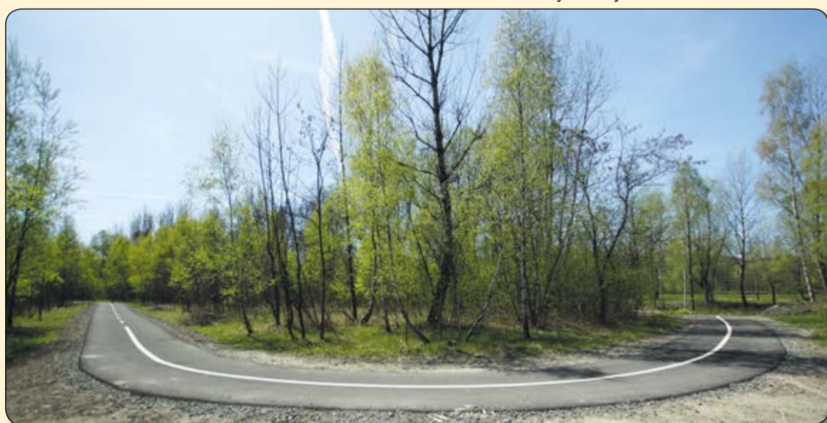
Řepiště – úsek cyklostezky pod odvalem Dolu Paskov