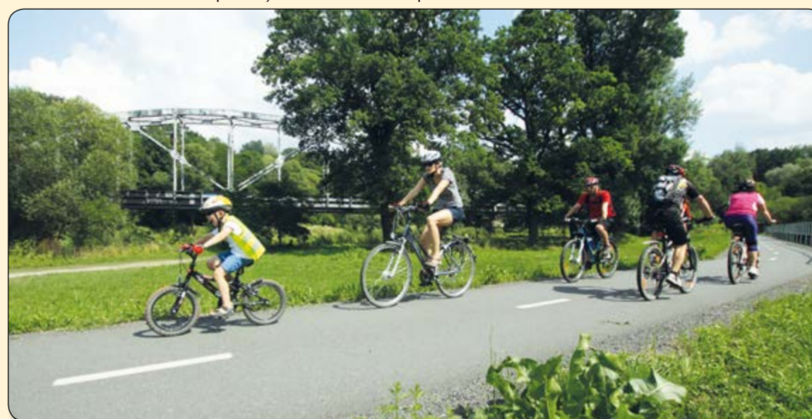
Paskov – provoz na cyklostezce u železničního mostu na Biocel