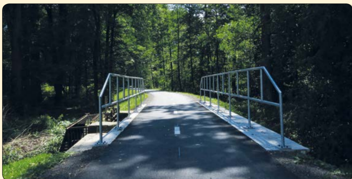
Žabeň – cyklostezka u mostu přes vodní náhon z Ostravice do zámeckého parku

o pět obcí – Vratimov, Řepiště, Paskov, Žabeň a Sviadnov. Trasa nově vybudovaného úseku měří 7,4 km. Přibližně z poloviny je vybudována na protipovodňové hrázi řeky Ostravice, kterou před vlastní stavbou cyklostezky rekonstruoval správce toku Povodí Odry, s. p. Klub českých turistů přidělil trase dvojmístné číslo 59. Tím ji fakticky zařadil mezi páteřní cyklostezky krajského až celostátního významu.