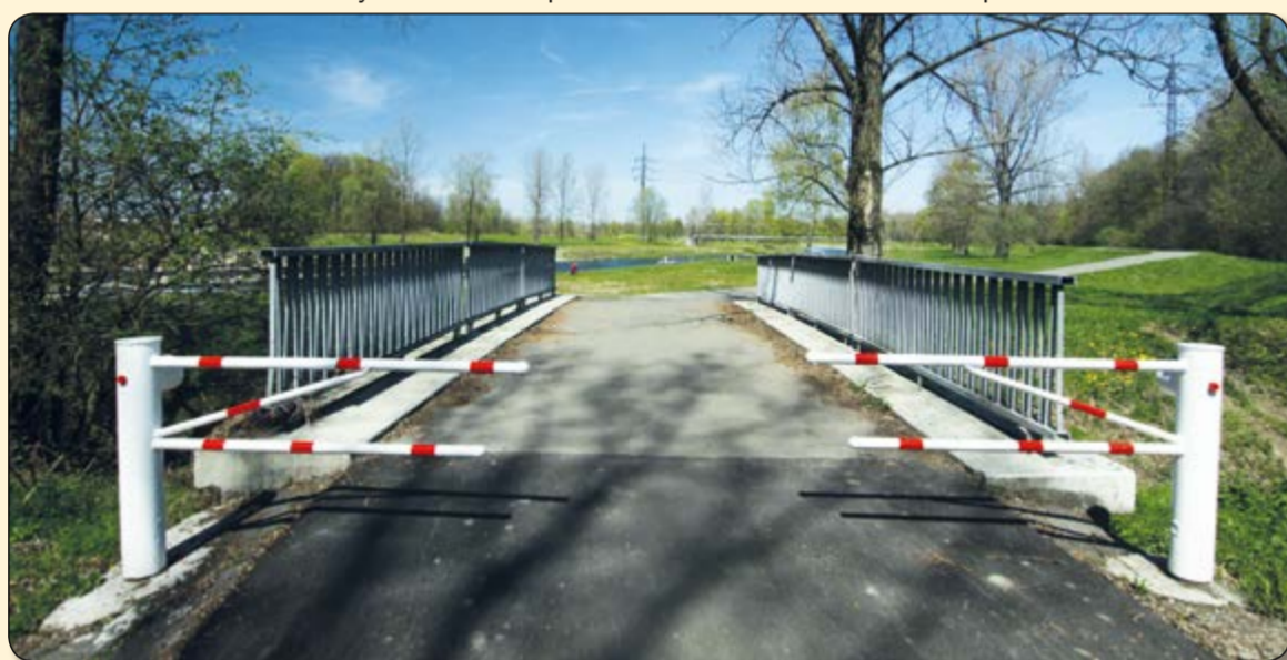
Vratimov – most se závorou na začátku nového úseku cyklostezky