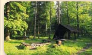
Vratimov – Les Důlnák