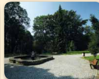
Šenov – Zámecký park