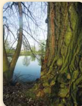
Žabeň – Žabeňské rybníky