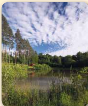
Kaňovice – Rybník Kamenec