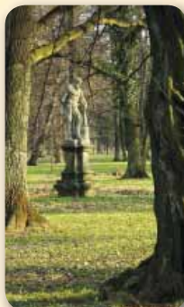
Paskov – Zámecký park