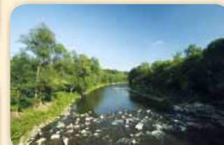
Řepiště – Řeka Ostravice