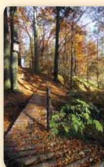
Václavovice – Ryninka