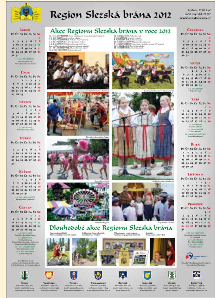
Kalendář – plakát – pro rok 2012