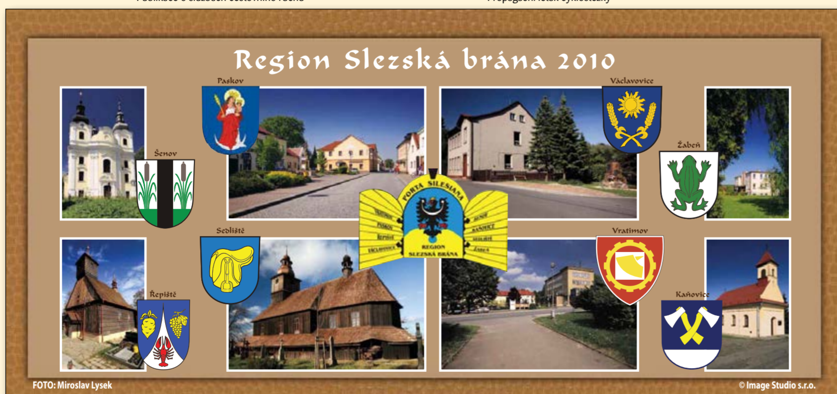
Stolní kalendář pro rok 2010