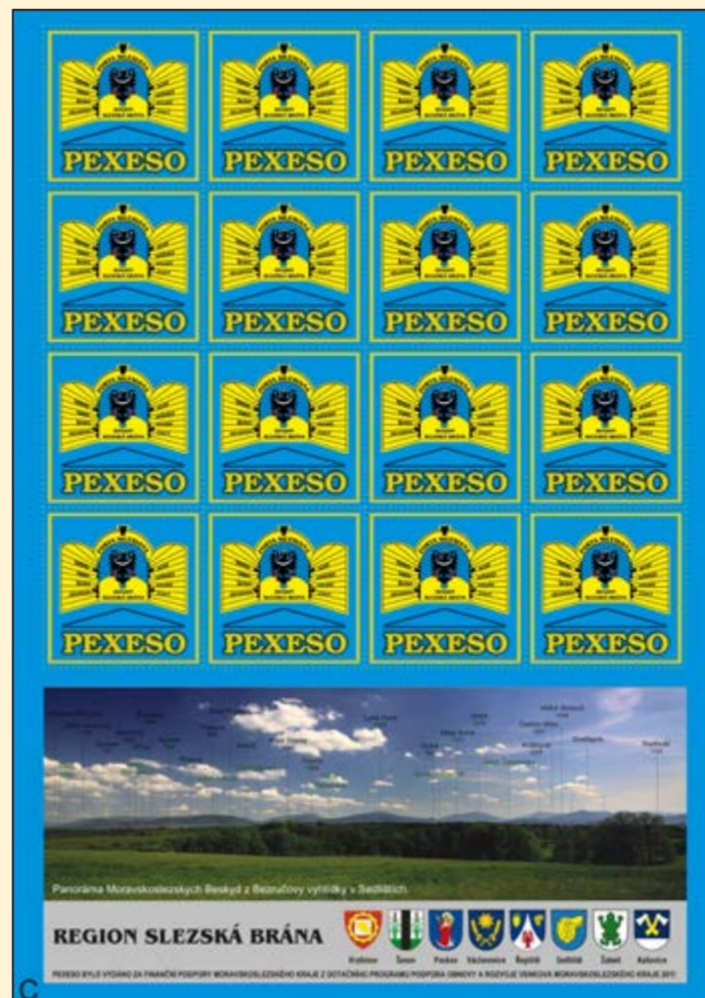
Pexeso Regionu Slezská brána