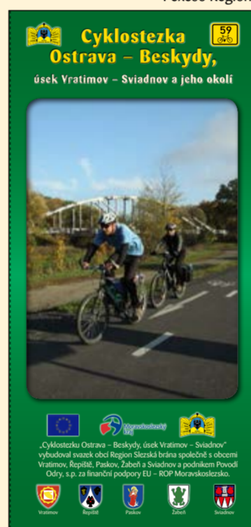
Propagační leták cyklostezky