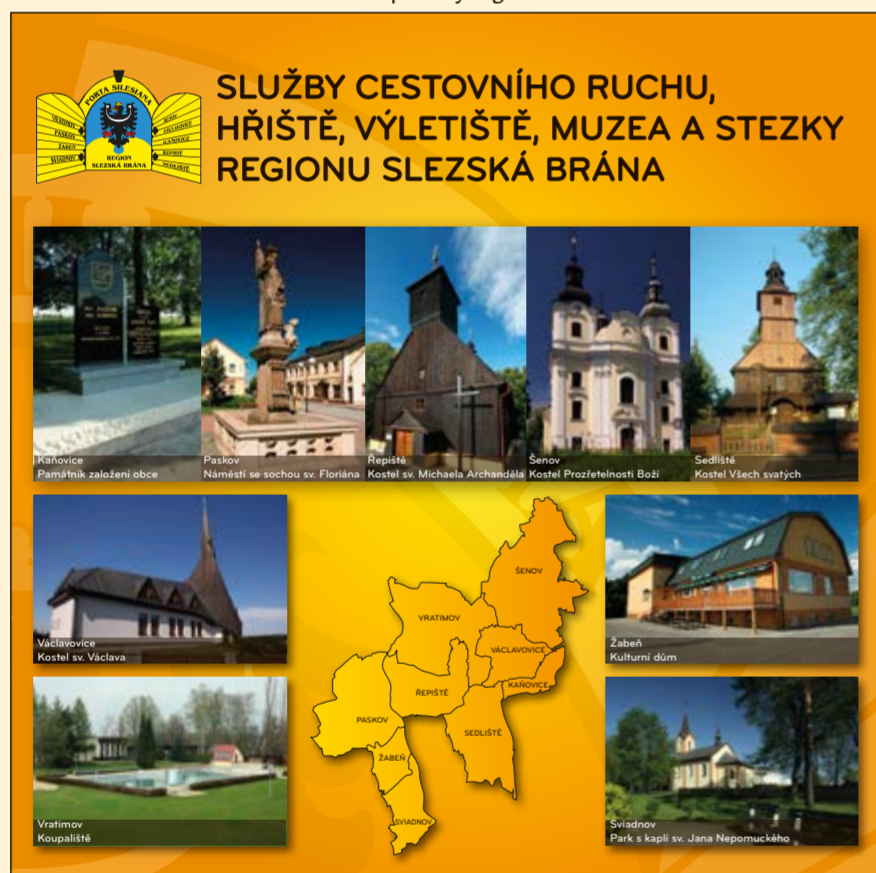
Publikace o službách cestovního ruchu