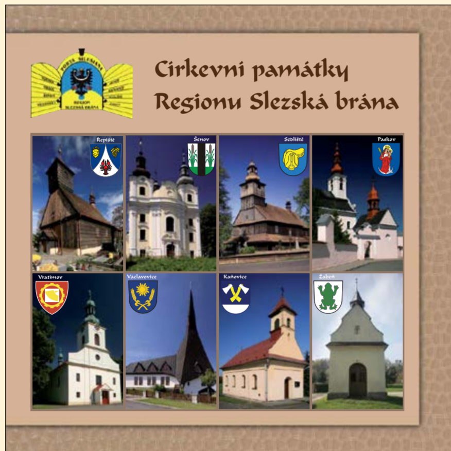
Publikace Církevní památky Regionu Slezská brána

nebo brožurky o konkrétních tématech. Stejně tak jako knihy se obvykle stávají podkladem vědomostních soutěží žáků a seniorů.