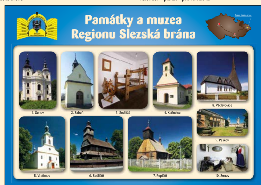
Pohlednice Regionu Slezská brána