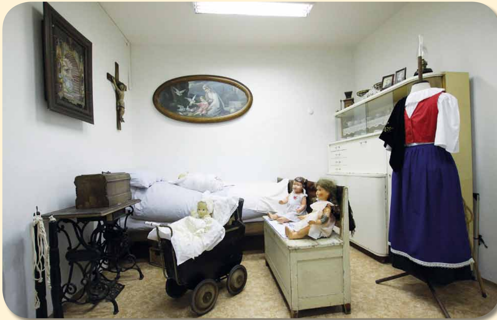
Stálá expozice Šenovského muzea

Zastavme se nyní u jména Vilém Wünsche. Tento nejvýznamnější šenovský rodák, malíř, grafik a ilustrátor se narodil v roce 1900 v havířské rodině a tematika havířů a prostředí dolů se staly jedněmi z jeho hlavních námětů. Ve svých dalších dílech pak zachytil život venkovanů v rodném kraji v jeho pevném sepětí s přírodou. Krátce před smrtí v roce 1984 byl zaslouženě jmenován národním umělcem. Nebyl ale jediným rodákem, jehož význam překročil hranice města. V Šenově se narodil i