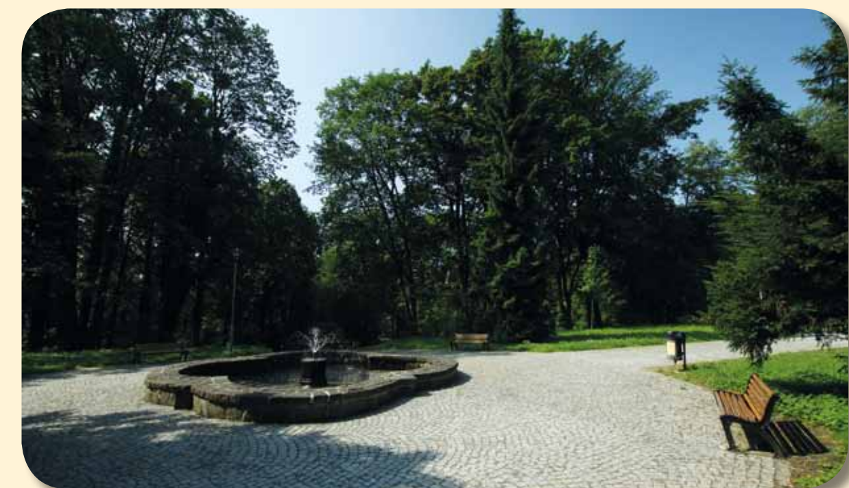
Zámecký park s kašnou

Dobrym průvodcem po zajímavostech města je Šenovská naučná stezka, která vznikla v roce 2004. Má dva okruhy. Malý okruh je dlouhý 1,5 km, prochází ulicemi města a má 6 zastavení u jeho historických památek. Velký okruh, dlouhý 10 km, seznamuje na sedmi místech návštěvníky s přírodními zajímavostmi v okolí města a jeho součástí je mimo jiné i zastavení na Skrbni, kde jsou k vidění čtyři větrné mlýny z let 1911-1922.