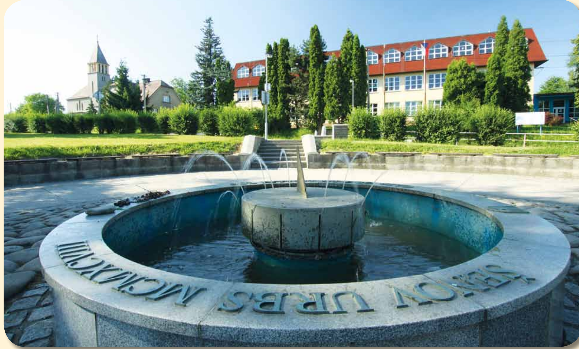
Radniční náměstí s kašnou

Přesné datum založení Šenova není známo, historikové připouštějí možnost jeho vzniku už ve 12. století, poprvé se ale obec zmiňuje až v listině z počátku 14. století, v níž je vyjmenována spolu s ostatními vesnicemi vratislavské diecéze povinnými odvádět desátky. Listina se dochovala pouze v opisu, který není datován, všeobecně se však uvádí, že byla sepsána zhruba v roce 1305. Název obce se tu uvádí ve tvaru Sonow. Z řady pánů, kteří se zde v prvních staletích vystřídali, vyniká v pramenech rod Šašků ze Šenova, kteří jsou v dochovaných listinách poprvé zmíněni k roku 1388. V roce 1531 koupili zdejší panství Sedlničtí z Choltic a s nimi bývají spojovány počátky šenovského zámku. Jeho vybudování do definitivní podoby ovšem zajistili ve druhé polovině 16. století až další majitelé – Skrbenští z Hříšče.