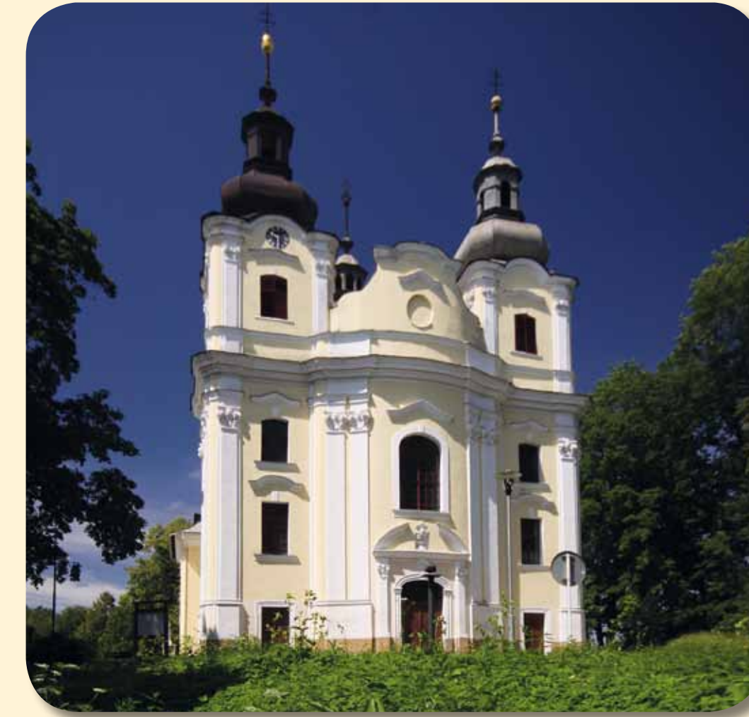
Farní kostel Prozřetelnosti Boží

V Šenově stojí ale ještě další církevní památky. Jsou to zejména zděná kaple církve evangelické - augsburského vyznání z roku 1896 a kostel Českobratrské církve evangelické. Jeho základní kámen byl položen na konci června 1936 a po roce byl